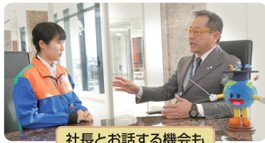
社長とお話する機会も