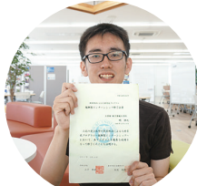
継続で自信がつく