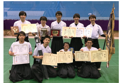
※出場当時の学年を記載しています。

★第61回東海学生弓道選手権大会 男子団体で見事優勝を成し遂げた。(射道優 秀賞受賞)