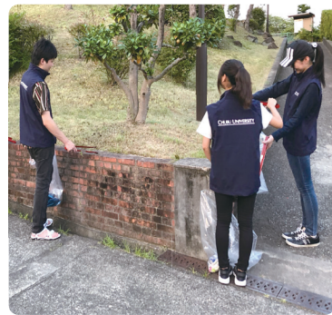
地域貢献活動(団地清掃)の様子

地域の方々との交流を通じて、人間力UPを目指す学生を募集しています。一定の条件のもと、趣旨に賛同する学生のみなさん専用で、特別料金で「賃貸物件」を紹介しており、入居スタイルは、シングルユースと、複数人でシェアできる物件があります。入居方法・入居条件については、学生支援課まで問い合わせてください。