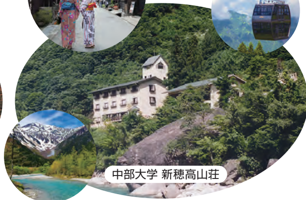
中部大学 新穂高山荘

中部大学HP 学生生活 > 施設紹介 https://www.chubu.ac.jp/student-life/facilities/