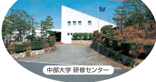
中部大学 研修センター