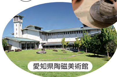
愛知県陶磁美術館