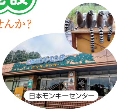
日本モンキーセンター